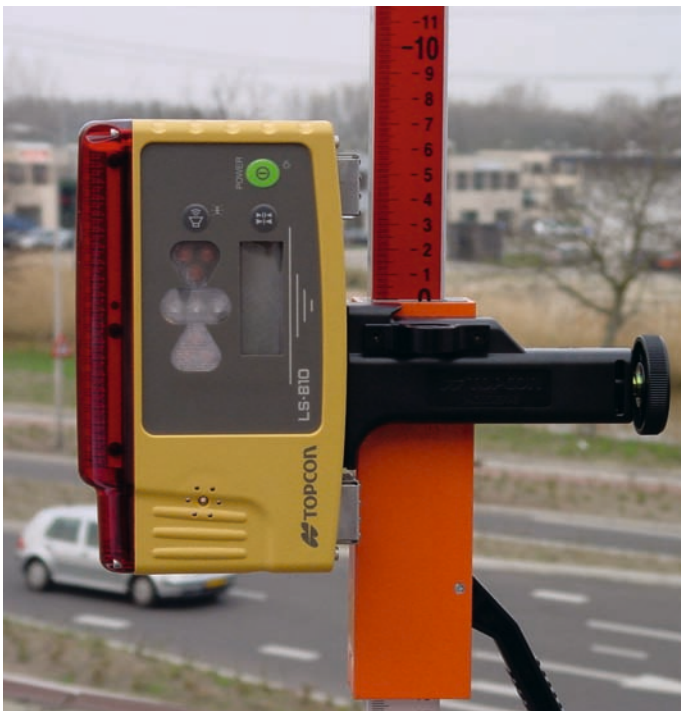
Gebruik als handontvanger m.b.v. optionele Holder-6